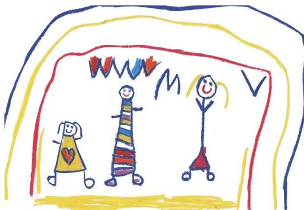
Logo výzkumu DOMOV